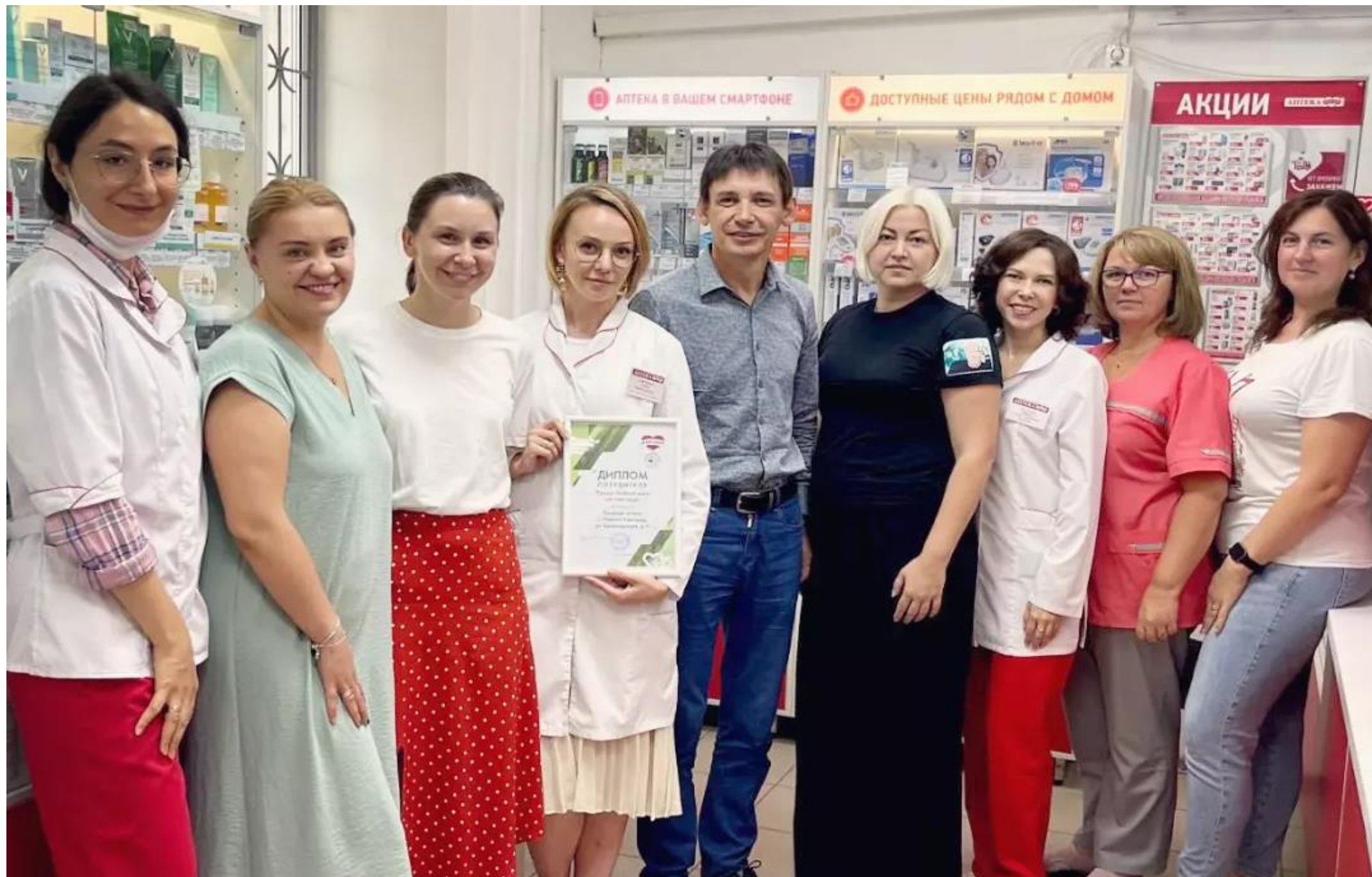
Вручение диплома за победу в номинации „Аптека Года“ в премии «Зеленый Крест - 2022»